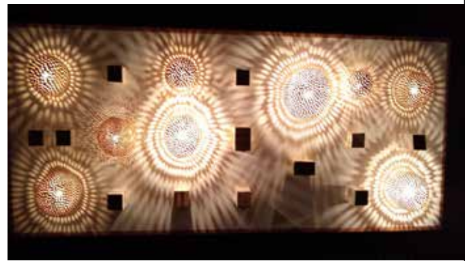
"Ombligos de luna" de Loida Pretis, 2024

edges of the figures like a sensitive drawing of light, memories and tides of the ocean that she carries within herself.