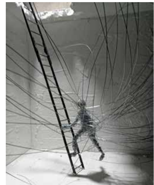
Jonhatan Durán con "Iluminación en el vacío"